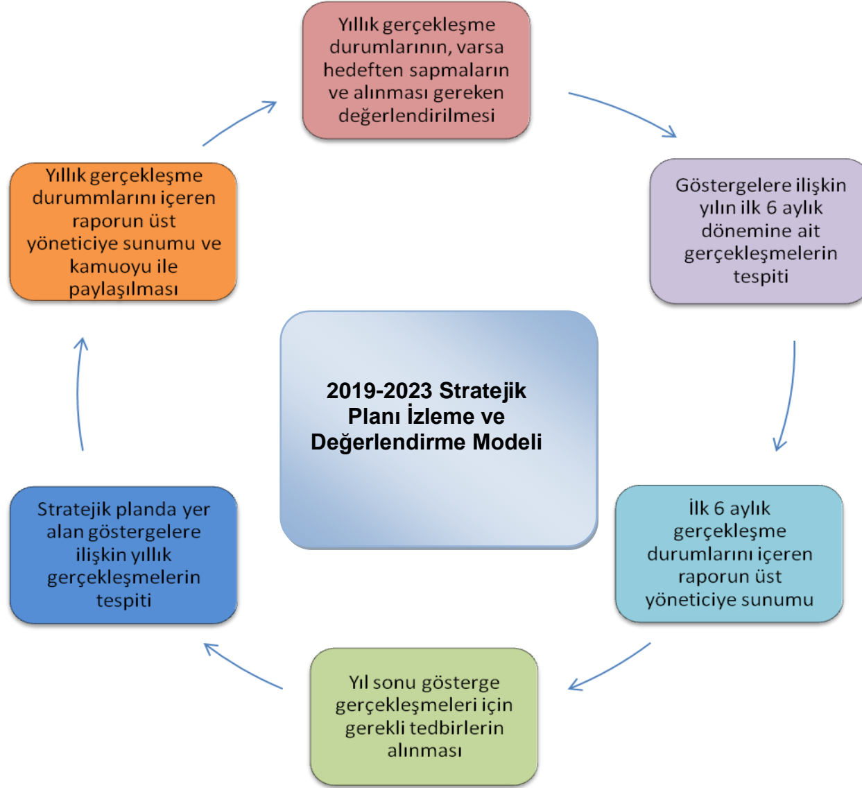
❖ Tablo 18: İzleme ve Değerlendirme Modeli